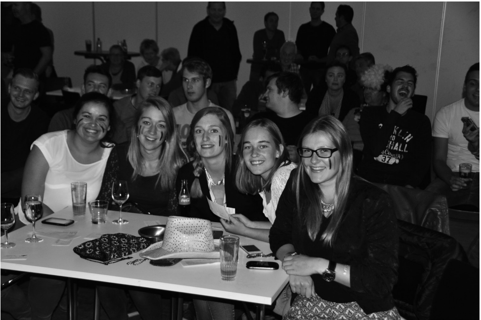
Boven: Ambiance bij de voetbalwedstrijd Rode Duivels-Bosnië-Herzegovina. Onder: de winnaars van de wandelzoektocht samen met de organisatoren van Groep-V.