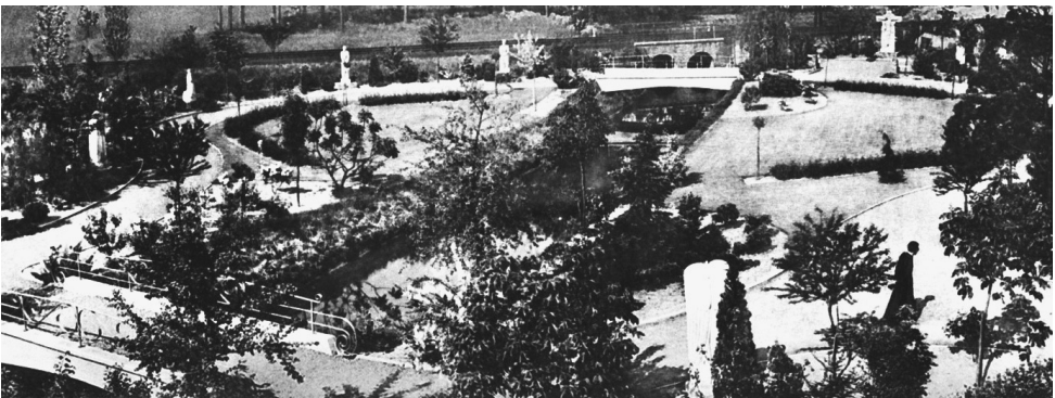
De Kalfortse Rozenkransweg, kort na de aanleg in 1952.

In het voorjaar worden alle Kalfortenaren nogmaals uitgenodigd voor een feestelijke receptie n.a.v. de inhuldiging van het park en de Rozenkransweg, als kroon op het werk van het Vrededaalproject. We houden u op de hoogte!