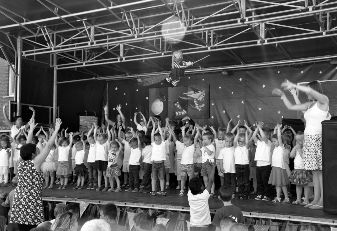
Bovenaan: alle kleuters samen met hun juffrouwen op het podium. Samen met heks Lotje zeggen ze alle aanwezigen nog eens feestelijk goeiedag! Onderaan: ... en de aanwezigen genoten ervan met volle teugen. Voor een keer kon dochter- of zoonlief schittereren als een echte artiest!