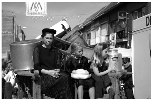
Boven groepen uit de "Grote Oorlog" uit vorige ommeegangen. Onderaan verhuis van de kostuums van de ommeegang van de dekenij in Puurs in september 2013.