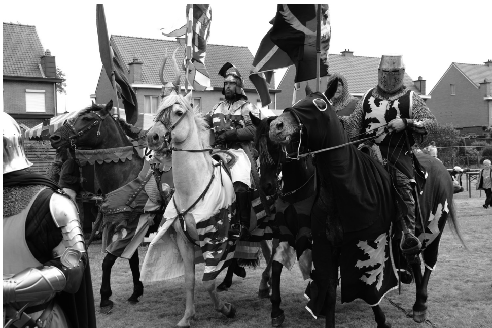
Boven: de Zwaardridders van Sint-Joris, die het toernooi verzorgden. Onder: de edellieden van Klein-Brabant, gespeeld door de leden van toneelgroep Plansjee.