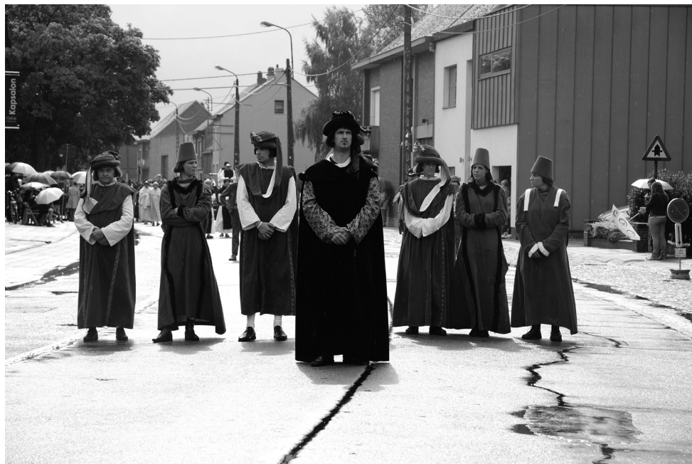
Boven: Jan Van Eyck dankt voor een geslaagde operatie. Onder: het beeld van Onze-Lieve-Vrouw komt toe aan de kerk.