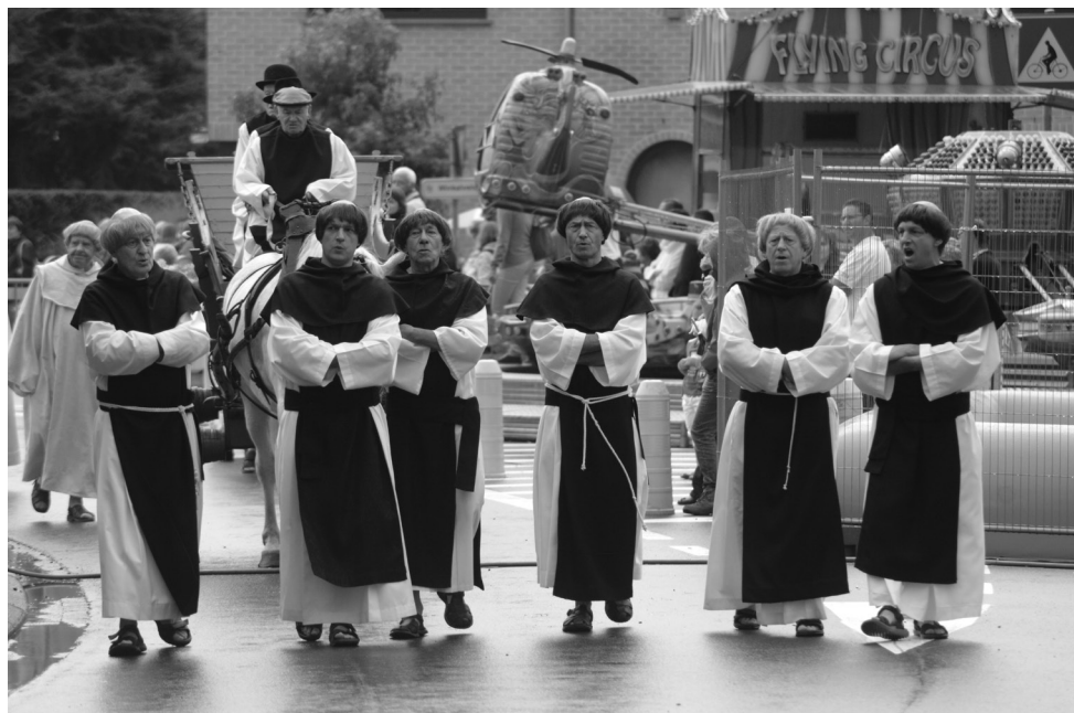
Boven: de monniken van Coolhem verlaten op last van de Franse bezetter hun refugie. Onder: Jezuskindjes trotseren de regen.