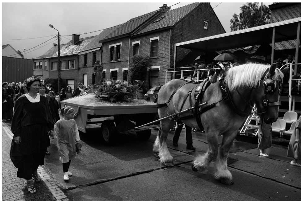
Boven: start van de verering van Onze-Lieve-Vrouw in Kalfort rond 1600. Onder: een gewonde kruisvaarder in het gevolg van Siger, heer van Coolhem.