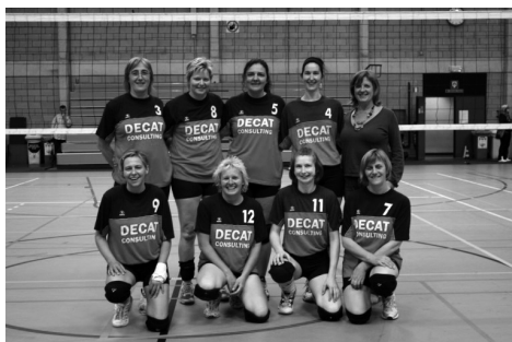
In 2009 wonnen 2 Kalfortse ploegen de beker. Bij de heren Kalfort A (links), bij de dames Kalfort 4 (rechts).