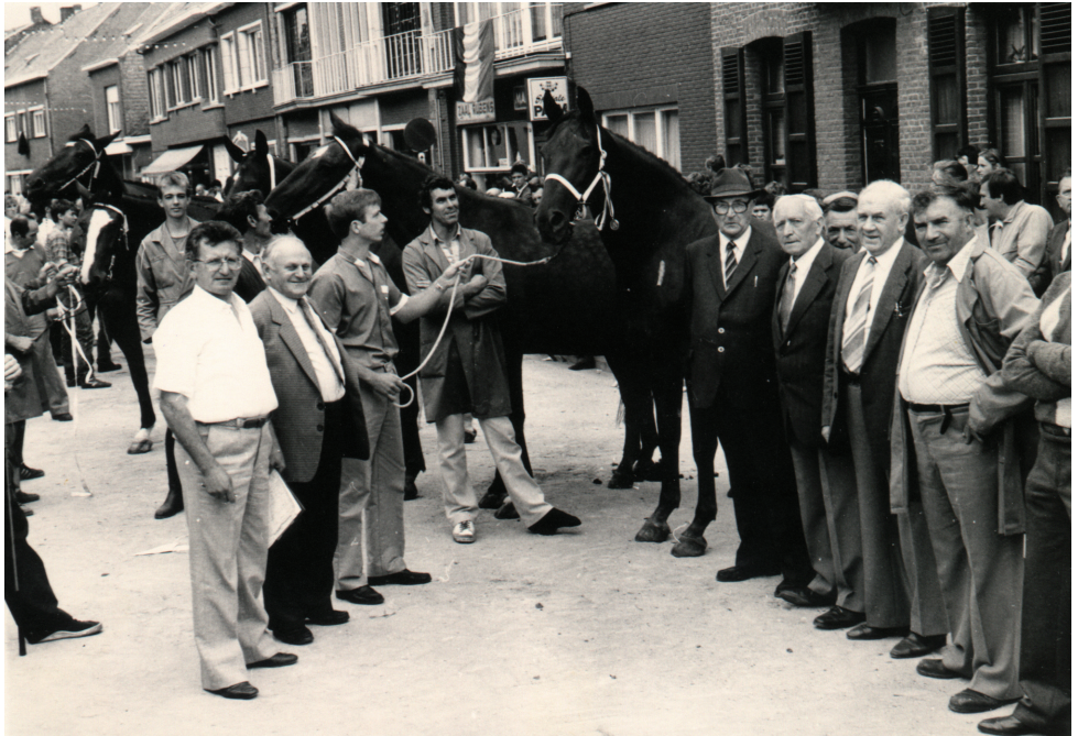
Jaarmarkt in Kalfort in de jaren tachtig, erfgenaam van de actie in het begin van de twintigste eeuw.

In 1907 is er sprake van de stichting van een geitenbond in Kalfort. De motivatie hiervoor is duidelijk. "De geit is de koe van de geringe man, en de kleine mensen helpen in hunne stoffelijke en maatschappelijke welvaart, is een daad waarvoor deze dankbaar zullen zijn: te Gent heeft een geitencongres bij alle vrienden van de volksklassen belangstelling verwekt en veel bijval genoten. Het oprichten van geitenbonden is ook in onze provincie op goeden weg. En eens die gesticht zullen de syndicaten,