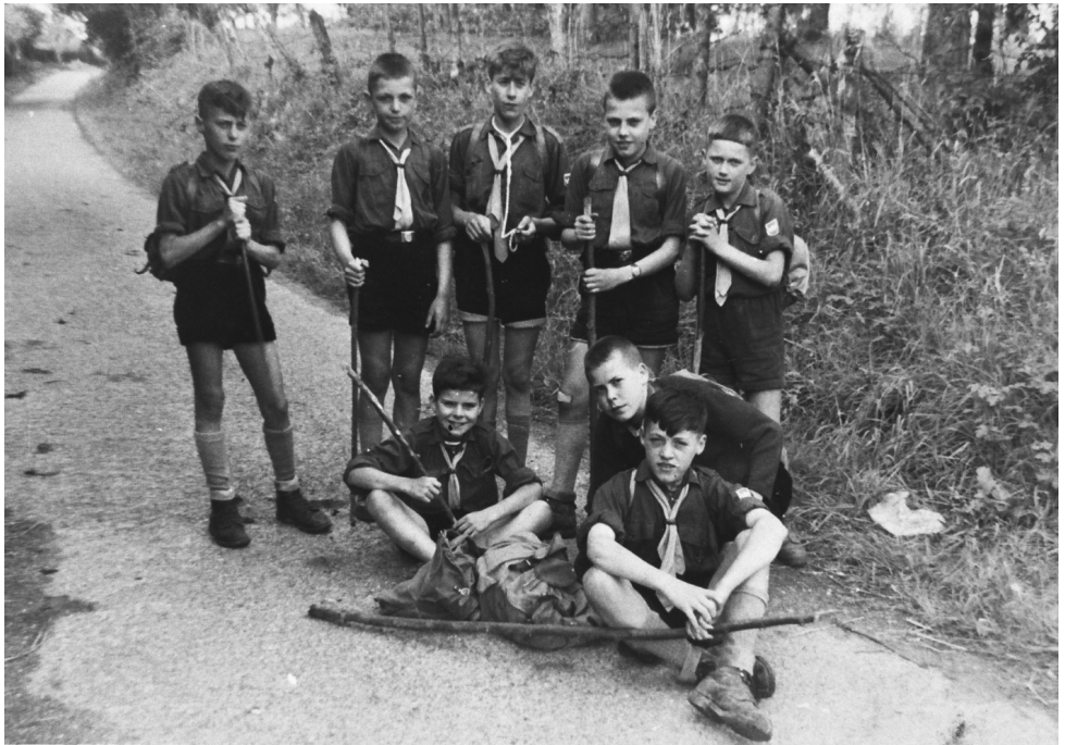
Chirojongens op bivak in Meerle in 1962. Wie bezorgt ons alle namen?