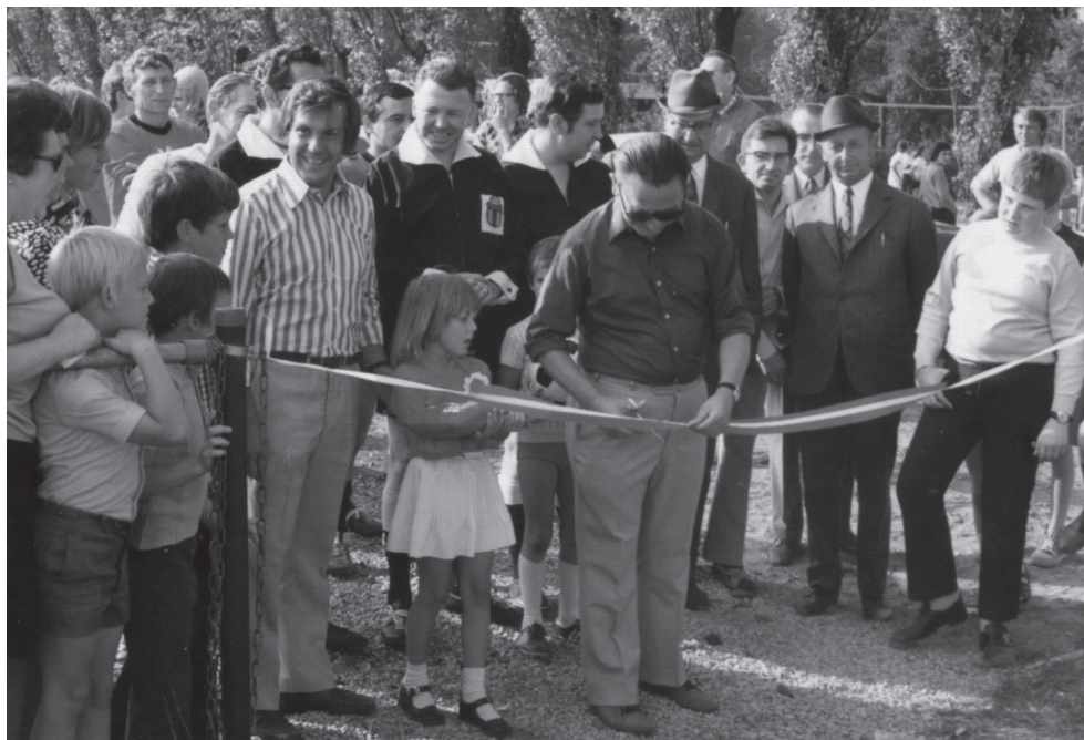
Officiële inhuulding van het nieuwe chalet en voetbalterrein in 1973.