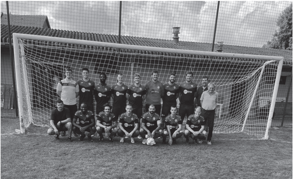
Eerste ploeg van Kalfort Daghet in het nieuwe seizoen.

Door de vertraging bij de bouw van het nieuwe voetbalgebouw en de slechte toestand van een plein in sportpark De