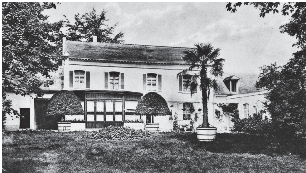
Het Hof van Coolhem van weleer.