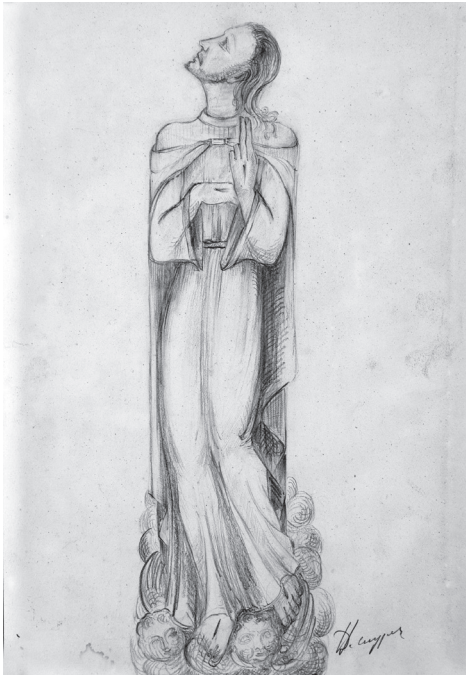
Hemelvaart van Christus. Ontwerptekening van een beeld van de Rozenkransweg door Herman De Cuyper.