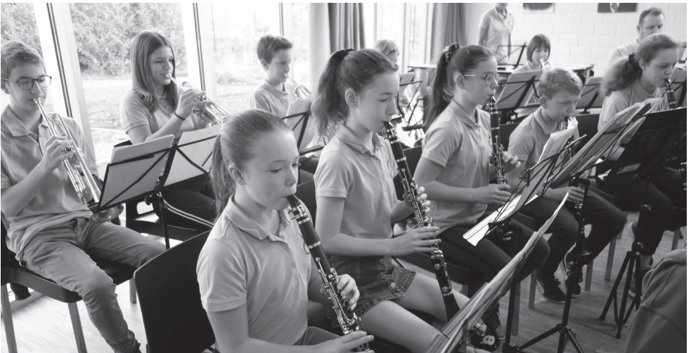
Jonge muzikanten aan de pupitter tijdens het aperitiefconcert.