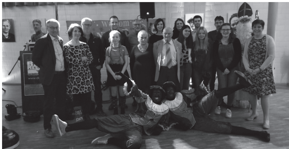
De gevierden op het ledenfeest van de Concordiavrienden.

Drie evenementen willen we er hier toch graag even uitlichten. Zo vierde onze vereniging op 16 november haar ledenfeest . Dat is een gezellig feest waarop wij alle Concordiavrienden bij elkaar brengen en de tijd nemen om elkaar ook naast de pupitter wat beter te leren kennen. Tijdens dat ledenfeest