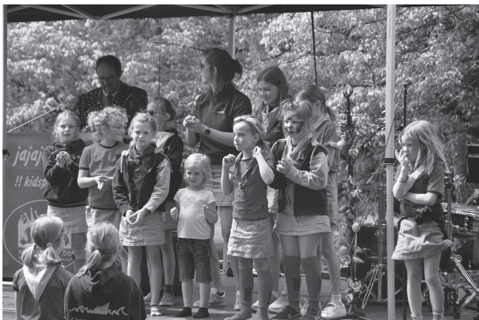
Park Populair 2019... een feest voor jong en oud!