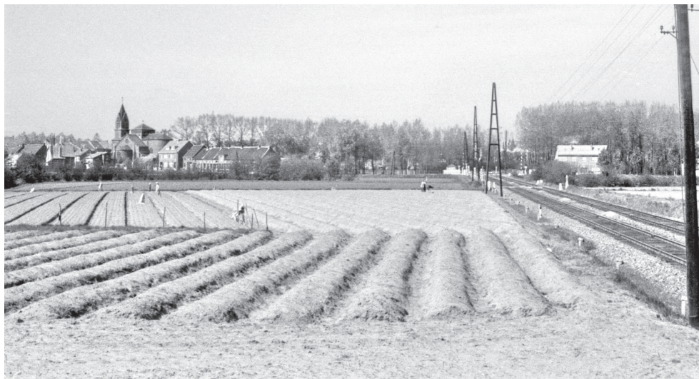
Aspergebermen achter de Coolhemstraat in 1958. Foto genomen vanop de nieuwe viaduct. Achteraan de plaats waar later de chirolokalen en de voetbalterreinen zullen komen.

Vooral de decennia 1920-30 waren succesjaren voor de inwoners van Kalfort. De gezinnen waren nog groot om mee te werken tijdens de oogst die loopt van eind april tot Sint-Jan (24 juni). Voor land- en tuinbouwers betekende de