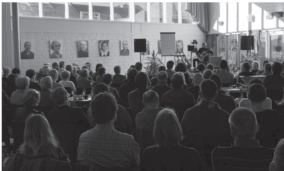
Op zondag 20 januari was er veel schoon volk in het dorps huis voor het apertiefconcert met gitaarvirtuoos Aram Van Ballaert, die op een spontane manier zijn programma Nylon & Steel bracht.