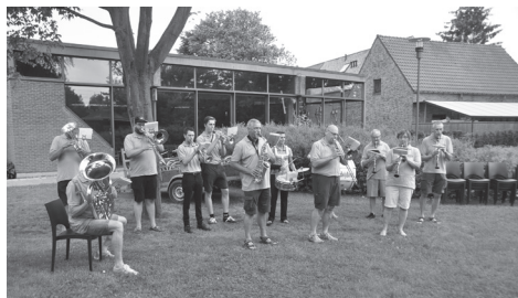
De Big Belly Band op het Park Populair van 2018.